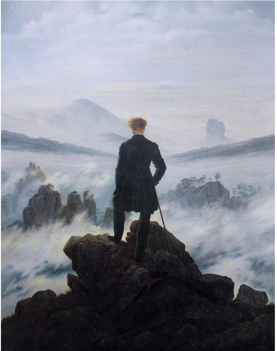
C. D. FRIEDRICH: WANDERER ÜBER DEM NEBELMEER